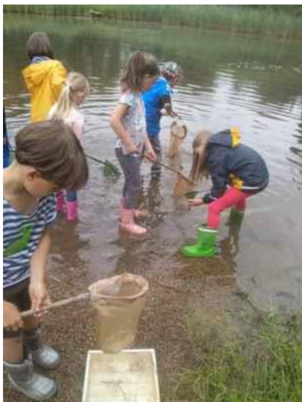
Projektový den Mokřady Jablonné MŠ a 1. ročník červen 2021