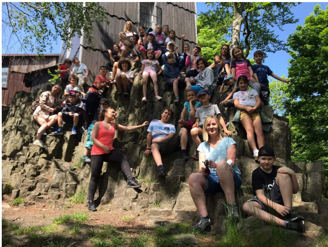
Projektový den – Ekovýlet na Vlčí horu