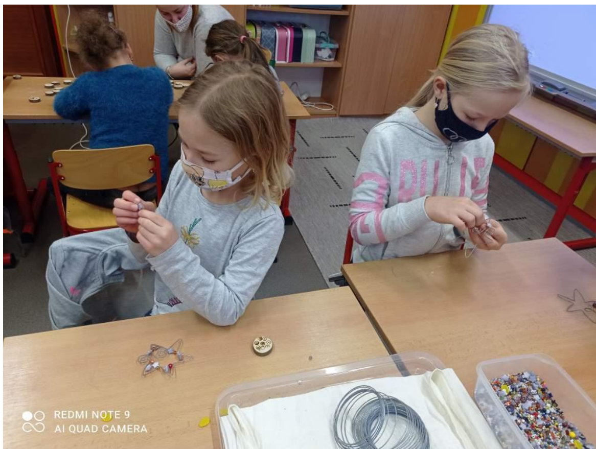
Vánoční dílničky – projektový den