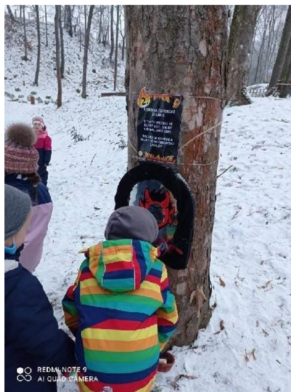
mikulášské překvapení v arboretu