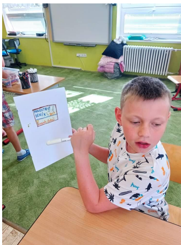
Projekt ERASMUS – Pátrání po ztracených místech - červen 2021