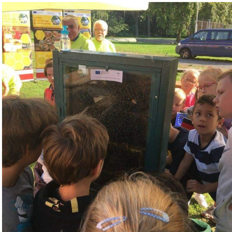
Přednáška o včelách za účasti senátora Jiřího Voseckého – září 2020