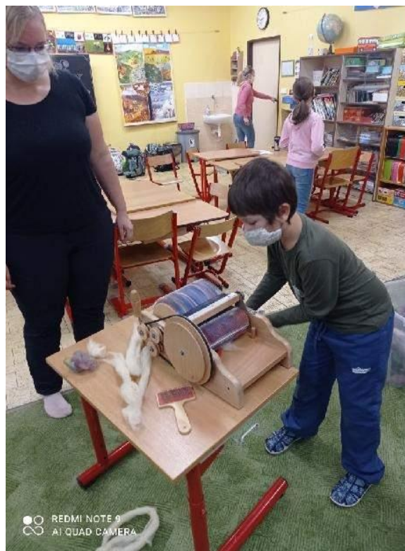
Ekohrátky – listopad 2020, projektový den s DDM Smetanka