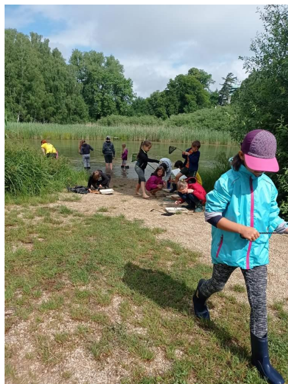
Mokřady Jablonné ZŠ 2. – 5. ročník – červen 2021