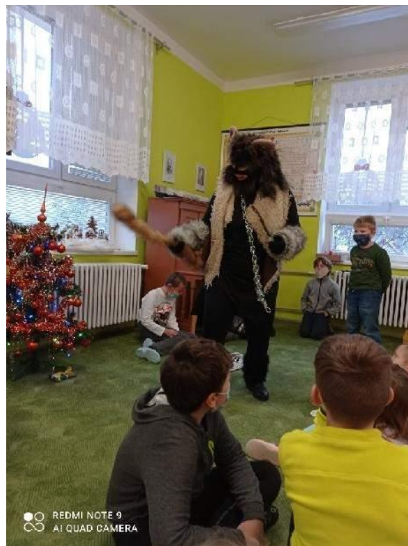
Mikuláš andělé a čerti - prosinec 2020