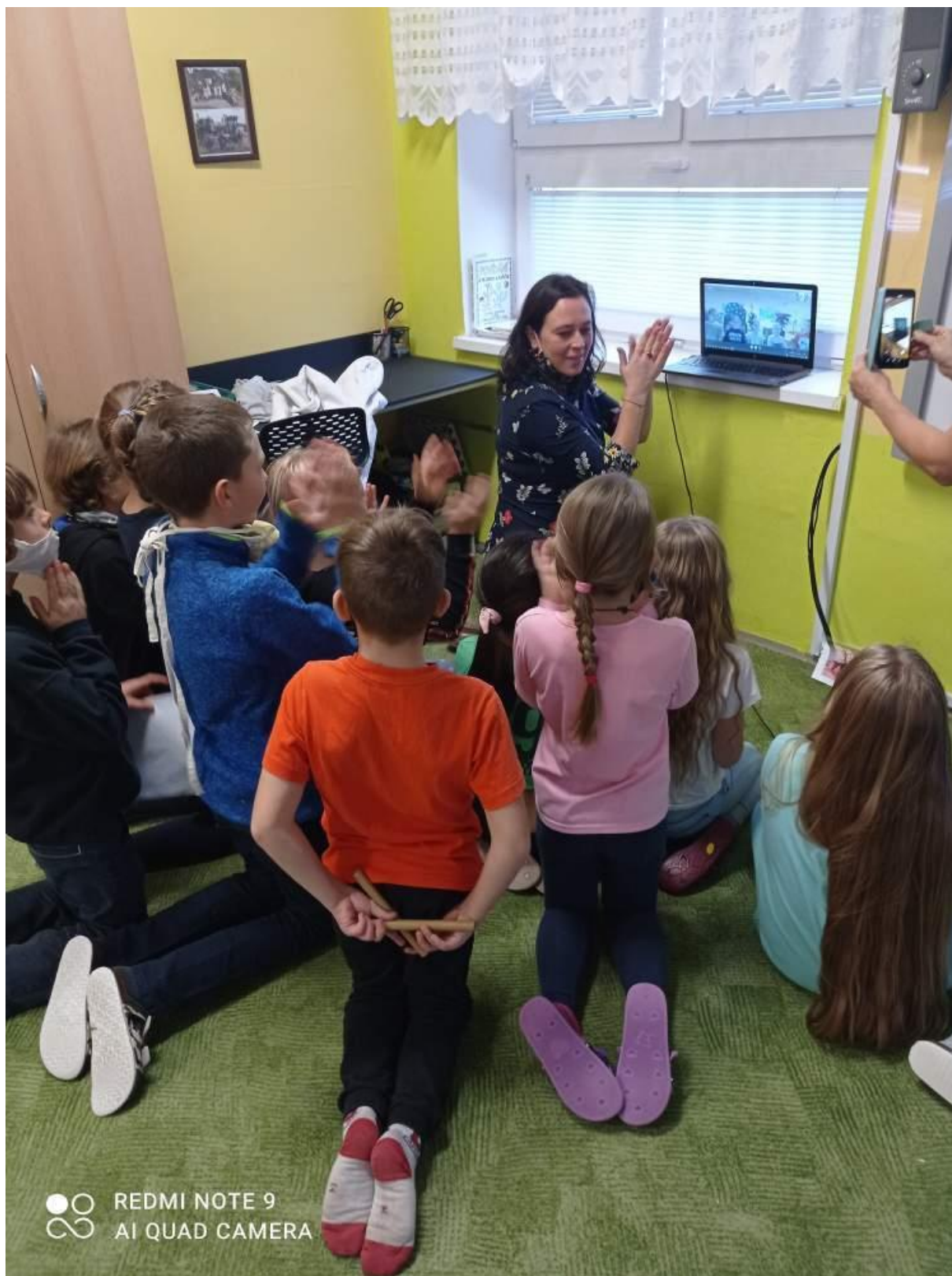
Videokonference s Litvou a Lotyšskem – leden 2020