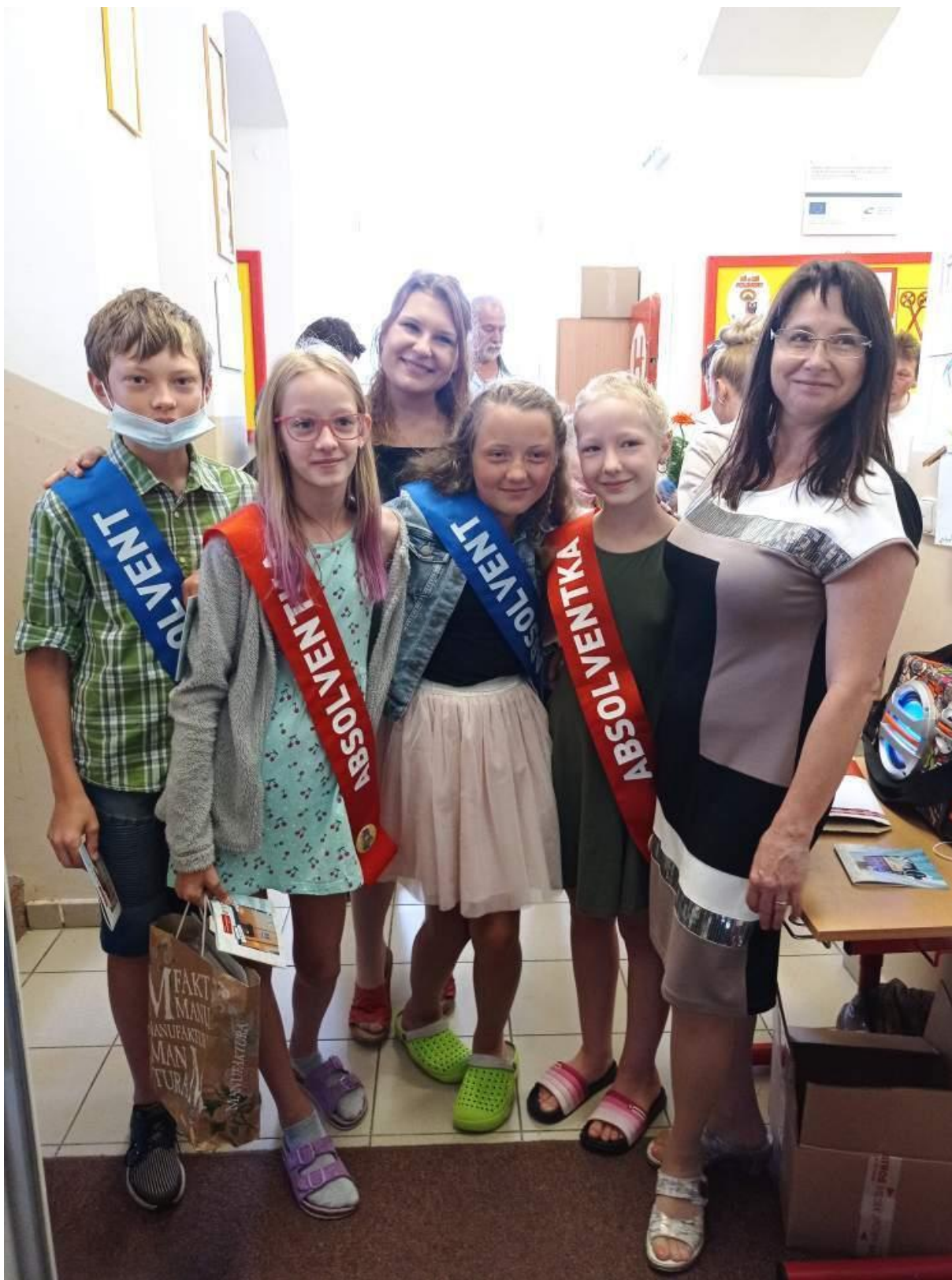
Závěr školního roku – rozloučení s žáky 5. ročníku