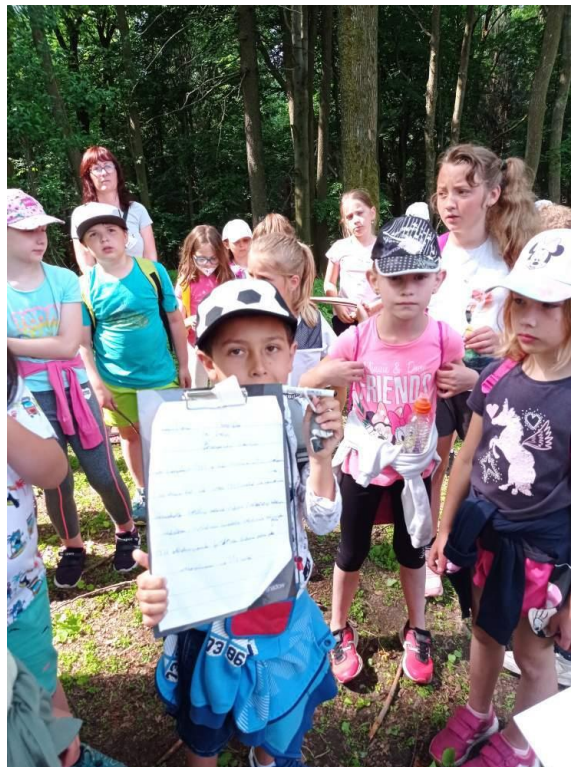
Projekt ERASMUS – Pátrání po ztracených místech - červen 2021