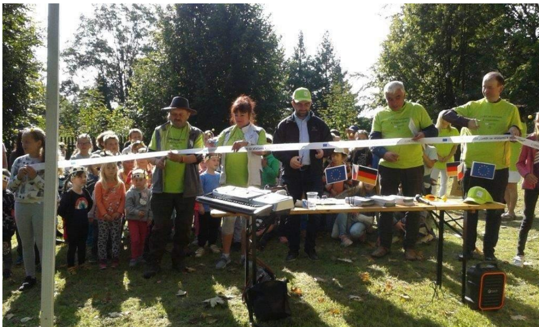
Slavnostní otevření arboreta – vystoupení žáků školy - září 2020